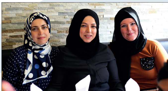
Teilnehmerinnen aus dem Projekt

„Es ist immer jemand da, der einem zuhört - PLANET ist wie meine zweite Familie.“