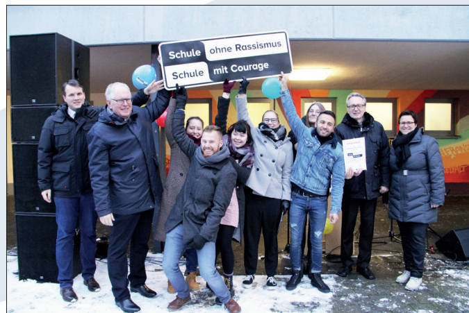
Siegelverleihung am Paul-Spiegel-Berufskolleg Dorsten