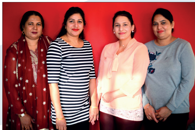
Teilnehmerinnen aus dem Projekt